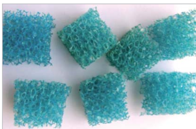
Figura 2. Cubos de espuma de poliuretano

procedencia; en general, sus constituyentes principales son el metano (45–75%) y el dióxido de carbono (25–50%); pero contiene trazas de otros compuestos, tales como H_2S , en concentraciones entre 100 y 20.000 ppmv (Ramírez et al., 2011a), siendo considerado este compuesto como el principal contaminante del biogás debido a su elevada toxicidad, efecto corrosivo sobre equipos electromecánicos y tuberías, la formación de óxidos de azufre durante la combustión del biogás, y, además, es el principal causante de los malos olores en los biodigestores (aunque pueden existir otros compuestos de azufre como los mercaptanos).