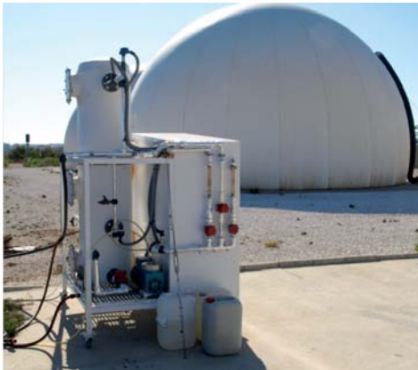
Figura 3. Biofiltro piloto instalado en la EDAR Cádiz-San Fernando

res superiores a los obtenidos por Soreanu et al. , (2008b; 2009), quienes reportan valores entre 9,0 y 11,8 gS-H 2 S m -3 h -1 , empleando biofiltros percoladores anóxicos empaquetados con fibras de plástico y roca volcánica.