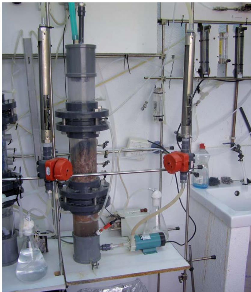
Figura 1. Biofiltro percolador anóxico empleado a escala de laboratorio

En los estudios a nivel de laboratorio se han empleado biofiltros percoladores desde 1 L hasta un máximo de 4,3 L, con espuma de poliuretano como soporte. Para la eliminación de H_2S se han utilizado biofiltros a pH neutro y ácido. En el sistema a pH neutro se empleó como inóculo Thiobacillus thioparus (Ramírez et al., 2009c), logrando